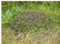
ドーム状のアリ塚(直径、高さは数十cm)