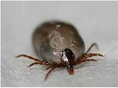
肉眼でも見える体長1~10ミリの「マダニ」

屋外のレジャーやガーデニングなどで注意したいのが「虫さされ」。 厚生労働省が注意を呼びかけているのが、野生の「マダニ」が媒介するウイルス性の感染症です。マダニから身を守りましょう。